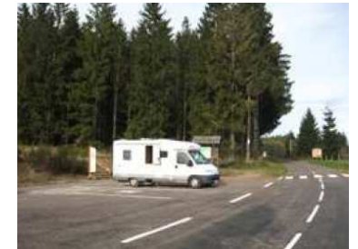
Table de lecture du paysage ; proche circuit de randonnée Le Roséria (départ Mairie de la Rosière).

Stationnement gratuit pour 2 camping-cars,